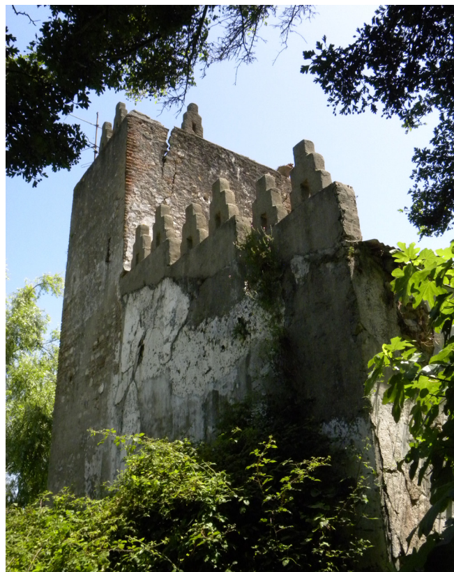
Fig. 2. Torre de la Fuente de la Higuera

En el Fuerte de Pinier la colonia fue localizada en el espacio central de la torre. Se trata de una fortificación completamente tapiada, pero con algunos orificios por los que se puede acceder. En estos momentos, este Fuerte se encuentra desocupado.