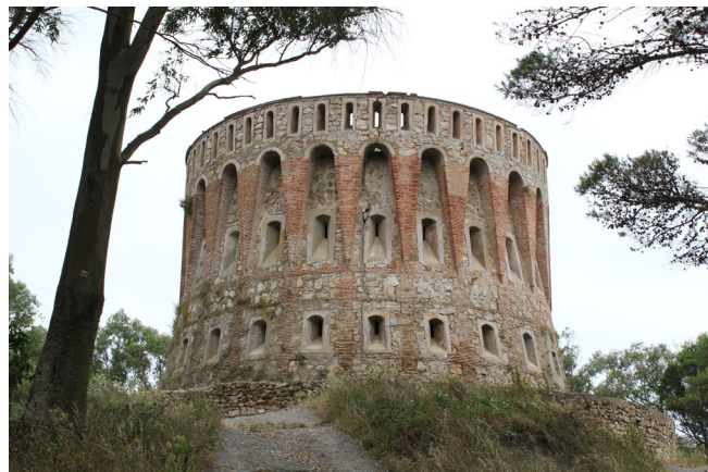
Fig. 1. Estructura típica de los fuertes presentes en los parajes de Ceuta (Fuerte de Isabel II)

Revisión de refugios: Las revisiones de los refugios fueron realizadas mediante revisión y recuento visual, valoración del número de individuos en cada refugio, y valoración de la cantidad de heces y rastros localizados. Para ver la lista de los refugios revisados ver Tabla 2. Se consideraron y revisaron todos aquellos refugios de los que se tenía constancia de la presencia de murciélagos en años anteriores, más un conjunto de refugios potenciales que fueron compilados previamente mediante una revisión exhaustiva de instalaciones y localidades repartidas en la Comunidad Autónoma de Ceuta.